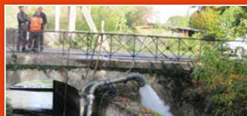
Opération diagnostic des vannes avant leur automatisation.