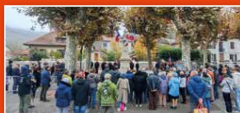
Une jolie foule pour la cérémonie du 11 novembre.