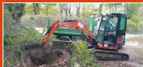
Curage d'un piège à pierres aux Arrondières par le service technique.