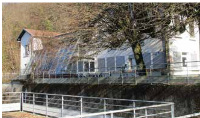
L'ancienne base de voie rive est Propriété du Pays Voironnais.

Dans la mesure où le Département n'a plus de projet pour ce site la com-