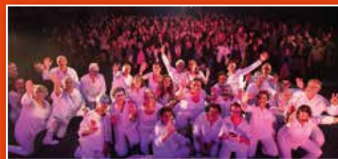
Cie Vocale : la dernière du Paradis Blanc à Charavines.