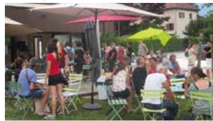
Les Comptoirs sont indissociables des grands RDV de nos saisons.

La buvette organisée à l'occasion du spectacle « Le paradis blanc » a représenté la dernière opération de l'équipe des Comptoirs pour l'année 2024. Une année particulièrement riche : environ 25 opérations, près de 15k€ d'excédents qui viendront alimenter le budget du CCAS. Encore une fois un grand merci à toute l'équipe des habitants volontaires : non seulement ils contribuent à mobiliser des ressources précieuses au service de la solidarité locale, de la vie associative, mais ils participent à faire vivre un lieu reconnu pour la qualité de l'ambiance créée lors des périodes d'ouverture.