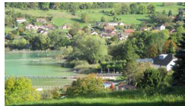
Nos paysages, entre transformation et préservation.

Toute construction, toute rénovation et tout aménagement transforme les sites ou les bâtis concernés, un édifice, un paysage, une vue. Deux débats se croisent alors :