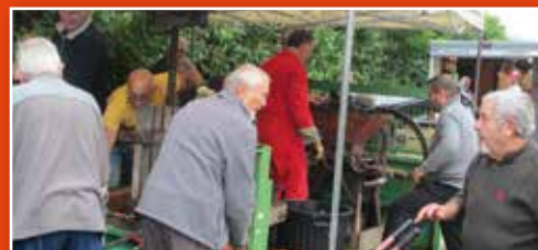
Jus de pommes, un moment prisé grâce à la mobilisation de l'équipe d'Anim'Chara